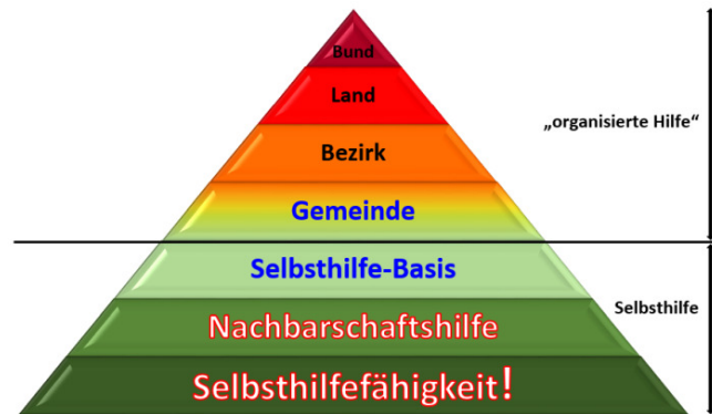
Abbildung 4:

Was uns oft erst im Katastrophenfall bewusst wird, sind die persönliche Rolle und die Vorsorgemaßnahmen jedes Einzelnen. Derzeit verlassen sich zu viele Menschen auf die organisierte Hilfe. Damit fehlt in vielen Bereichen eine ganz wesentliche Basis, um mit weitreichenden Infrastrukturausfällen umgehen zu können. Denn die Mitglieder der Einsatzorganisationen und deren Familien werden in einem solchen Katastrophenfall ebenfalls zu Betroffenen. Dadurch können sie anderen Menschen nur mehr eingeschränkt helfen.