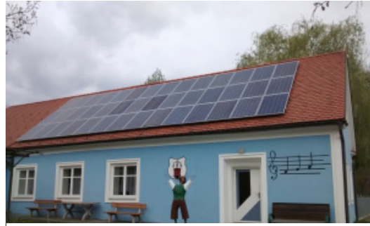
Abbildung 5: Vereinshaus mit PV-Anlage

Um einen möglichst durchgehenden Betrieb sicherstellen zu können, ist zudem eine Beleuchtung erforderlich. Diese kann entweder über ein Notstromaggregat oder über eine inselbetriebsfähige/notversorgungsfähige Photovoltaikanlagen erfolgen. 11 Bei einer Notstromaggregatversorgung sind jedoch zahlreiche Aspekte zu berücksichtigen, 12 wie: