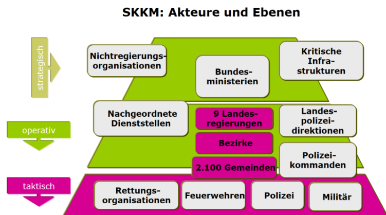
Abbildung 1:

Die erste Ebene bildet die Gemeinde mit ihrer Bevölkerung. Erst wenn die lokalen Strukturen in der Gemeinde überfordert sind, ist eine subsidiäre Intervention vorgesehen. Sprich, die nächste (Verwaltungs-)Ebene unterstützt bei der Bewältigung.